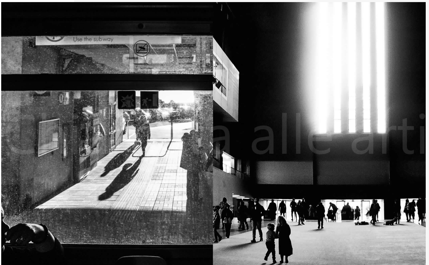
Astra di Costangelo Pacilio - Progetto Chiamata alle Arti